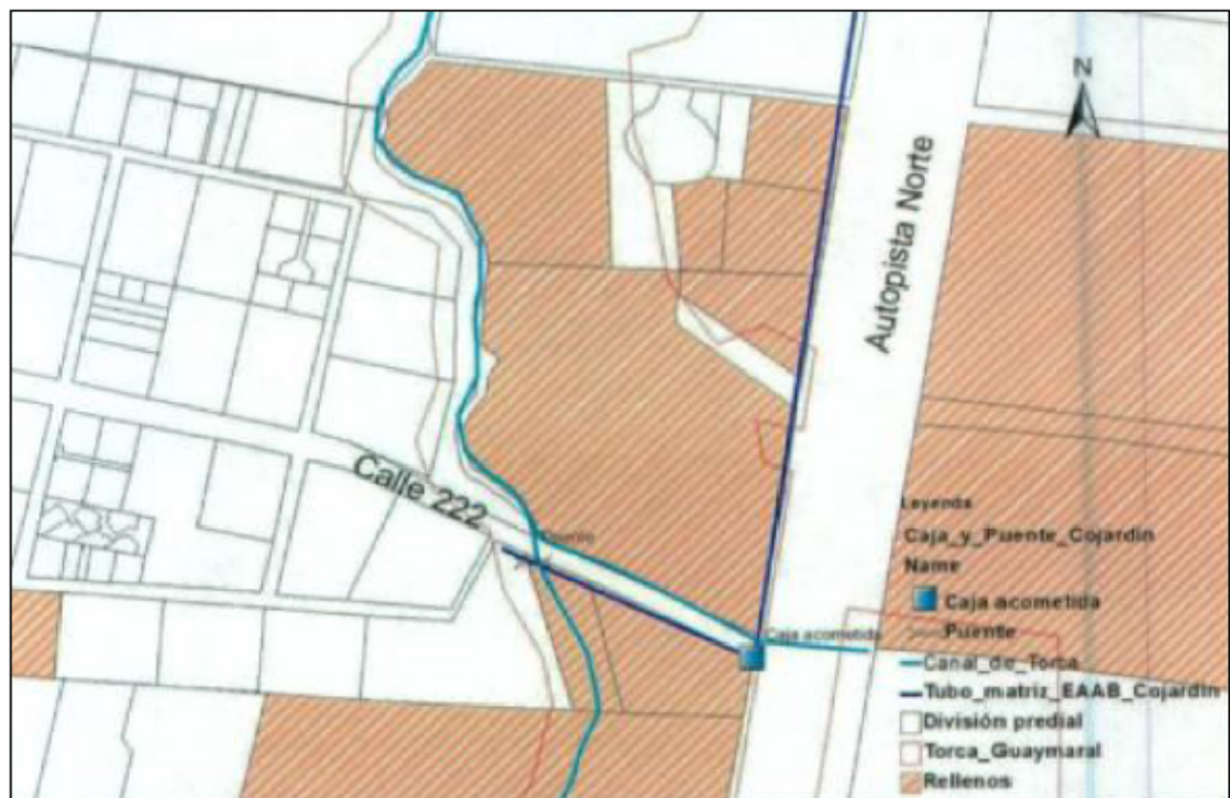
Imagen No. 3. Ubicación de la tubería de agua potable.

“La solicitud de agua potable hecha por la empresa Cojardín a la Empresa de Acueducto de Bogotá (EAAB), resultó en la entrega de una acometida en la autopista norte con Calle 222. Como se puede observar en la Ilustración 1, esta acometida fue entregada por la EAAB en una caja (cuadro de color azul) dentro del amojonamiento del humedal de Torca Guaymaral (línea de color rojo) trayendo una tubería matriz desde la calle 235 hasta la calle 222 (línea azul oscura) por la autopista norte. A partir de este punto la empresa Cojardín tuvo que atravesar el humedal de Guaymaral para poder conectarse con la red de distribución de agua potable” (Radicado No. 2013ER093271).