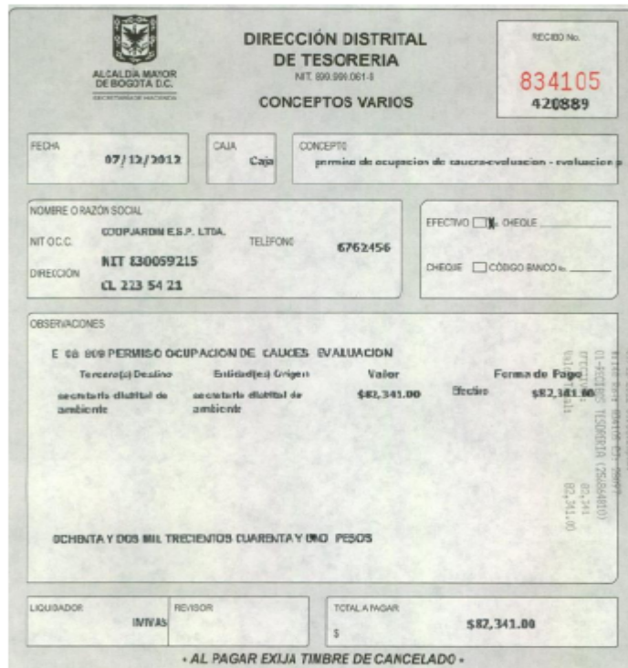
Imagen No. 2. Pago por concepto de evaluación a POC.

La Empresa COJARDIN S.A. E.S.P., remitió mediante radicado No. 2012ER150827 recibo de pago por concepto de evaluación a permiso de ocupación de cauce –POC, por un valor de $ 82.341,00 pesos y No. de consignación 834105.