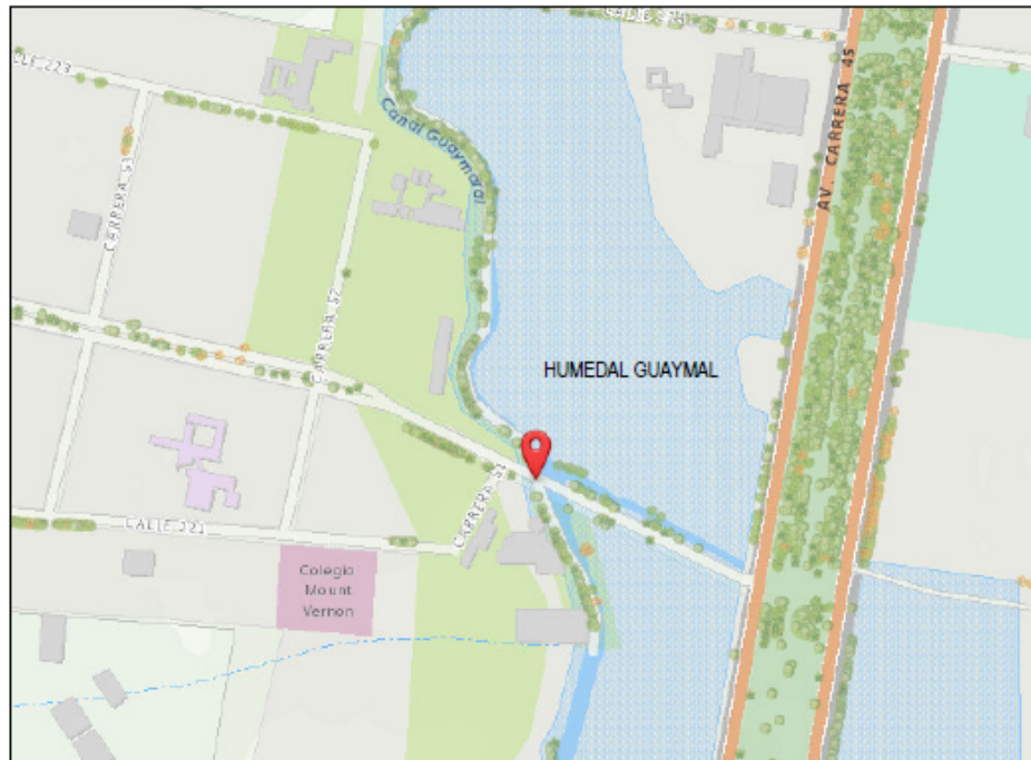
Imagen No. 1. Ubicación general de zona intervenida por el puente peatonal y la red de agua potable.