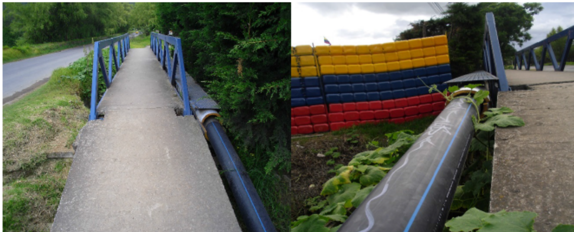
Fotografías No. 1 y 2. Puente y estructura que permite el paso de la tubería de 8" sobre el canal Guaymaral.